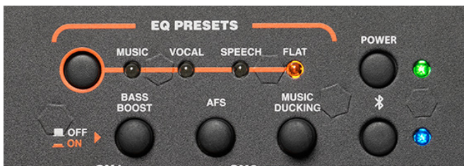
버튼 하나로 컨트롤 할 수 있는 다양한 기능들