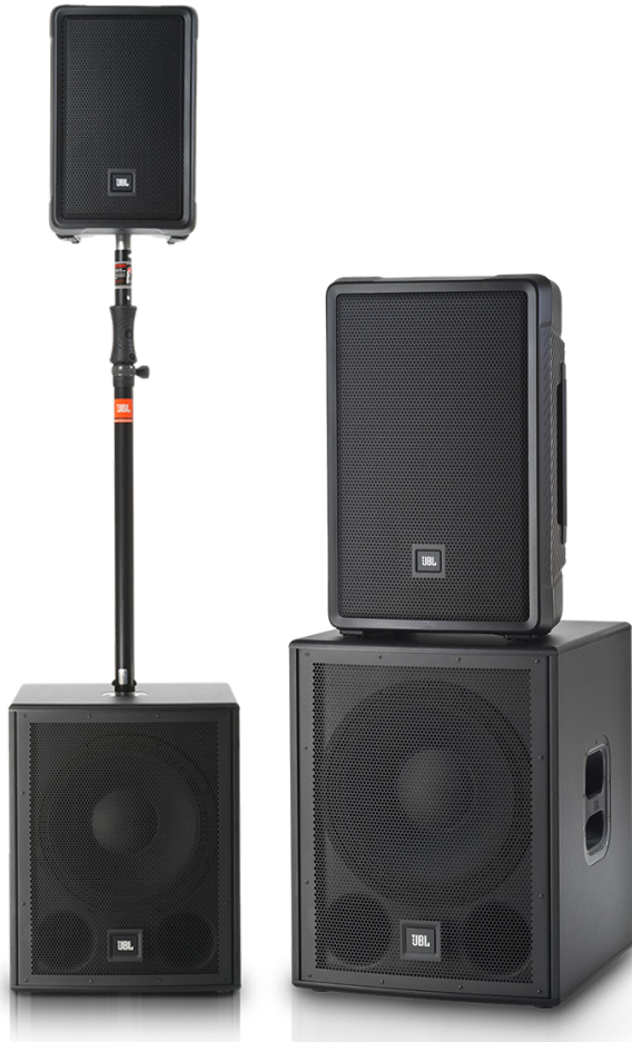
IRX 시리즈는 스피커와 우퍼를 사용자 편의에 맞게 디자인하여 활용할 수 있다

윗지 모니터 스피커로 편리하게 스택 할 수 있도록 뒷면에 디자인적으로 각도를 부여했다. 하단부에는 스탠드에 쉽게 얹을 수 있는 홈도 디자인되어 있다.