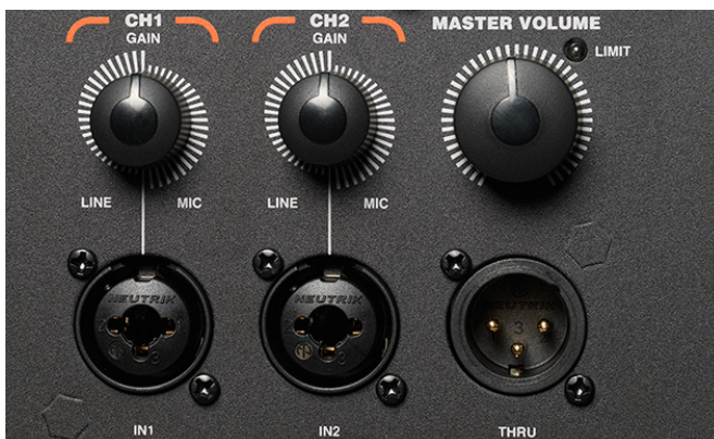
JBL IRX 시리즈는 1개의 마이크/TRS 입력과 신호 전달 포트를 제공한다